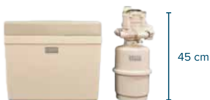
DELTA ISERA | DTSO-100B INHOUD ZOUTBAK: 25KG

3 LITER HARS - DOORSTROOMSNELHEID 1.500 LITER/UUR