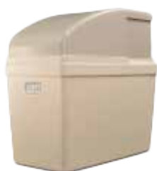
DELTA ESCALDA | DTSO-100M INHOUD ZOUTBAK: 15KG